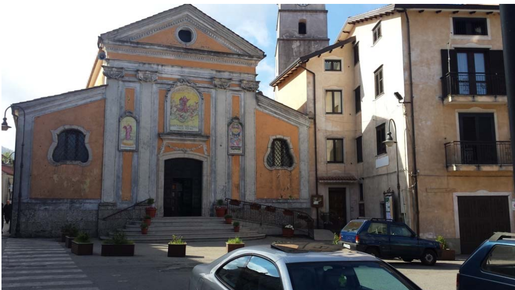
Chiesa Santa Maria degli Angeli e piazza D'Aste