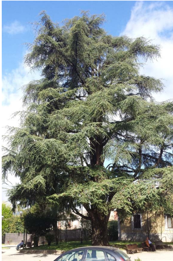
Cedro del Libano nella Villa Comunale