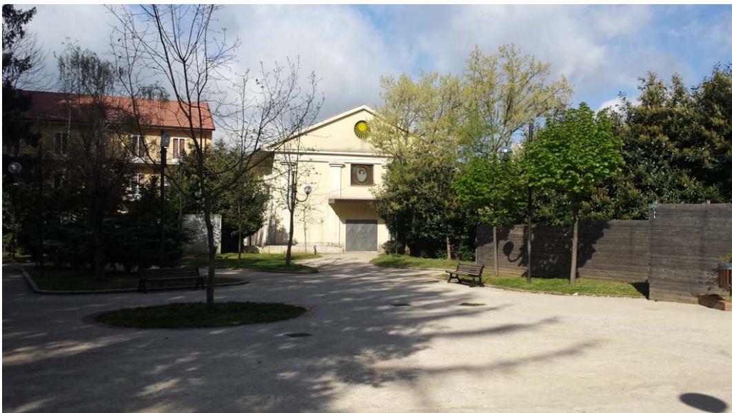
Villa Comunale e cinema parrocchiale