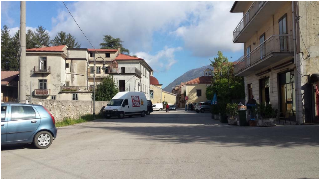
Via Dott. Giuseppe Cuozzo (ex Via Murge)