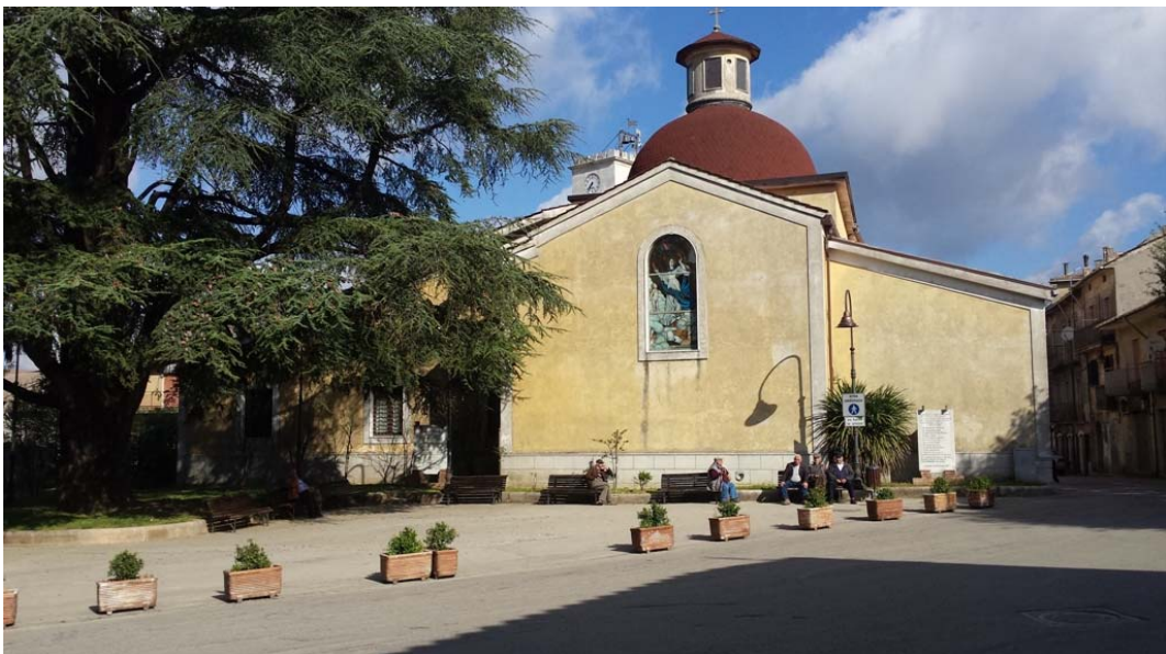
Villa Comunale e Chiesa Santa Maria degli Angeli