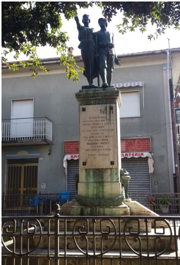
Monumento ai Caduti in Piazza Freda