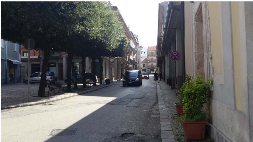
Via Tenente D'Urso