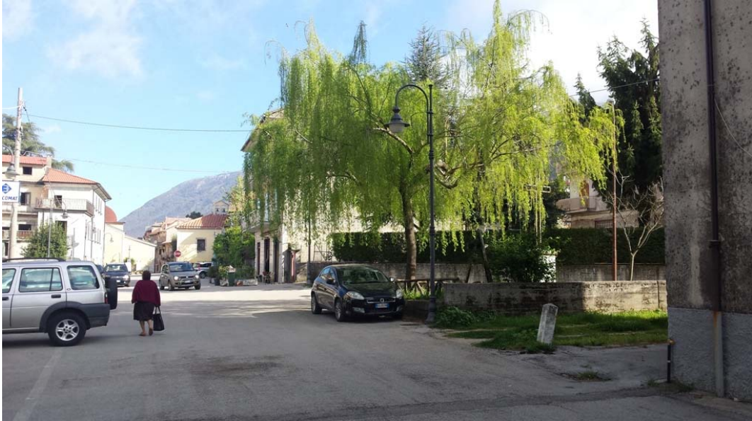
Via Dott. Giuseppe Cuozzo (ex Via Murge)